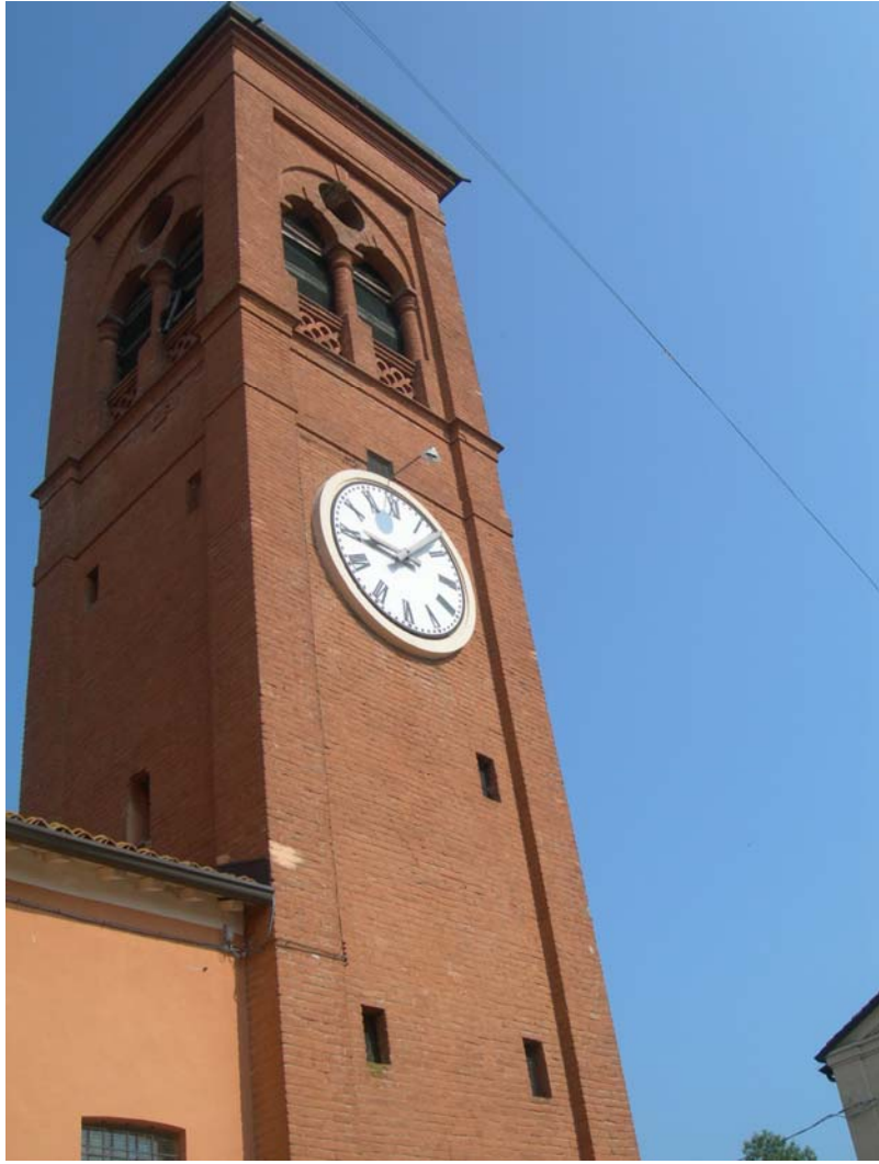
FOTO 5 - il campanile, lato est