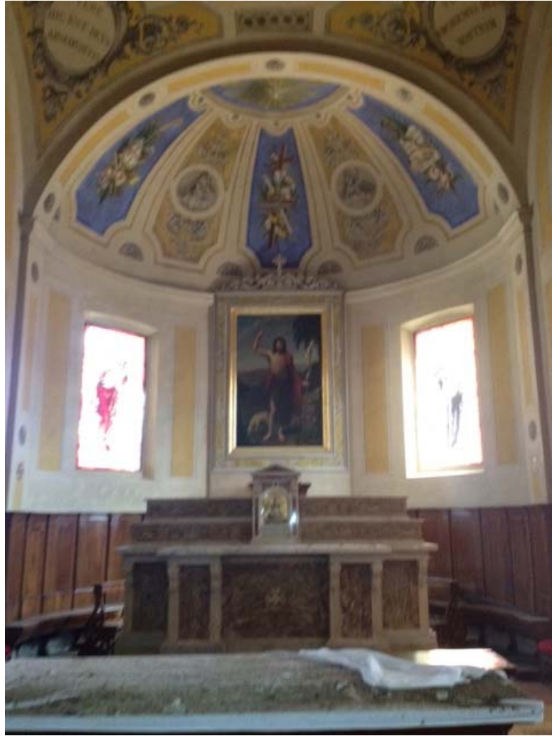
FOTO 13 - vista del catino absidale