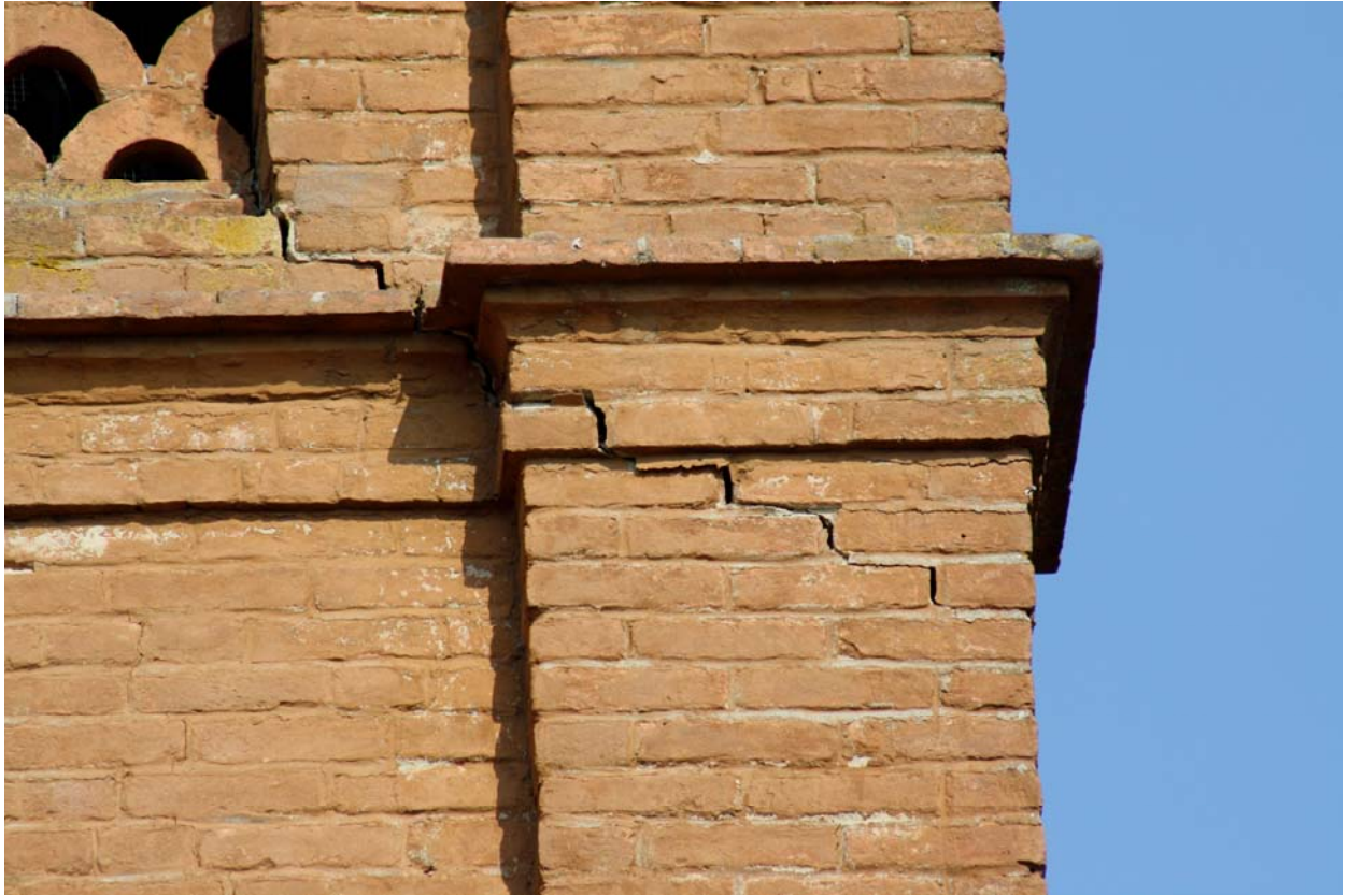
FOTO 7 - lesione diagonale alla base della cella campanaria del campanile