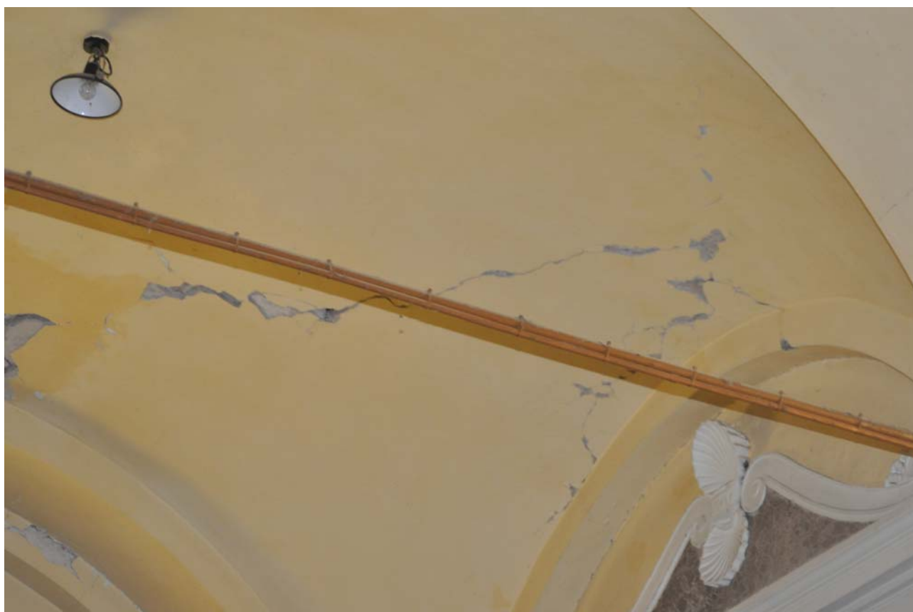
FOTO 22 - fessurazioni su volta della navata laterale destra