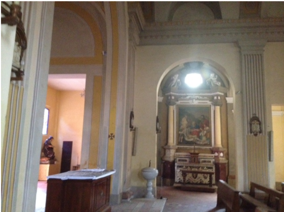
FOTO 18 - vista della navata laterale destra, all'innesto col transetto