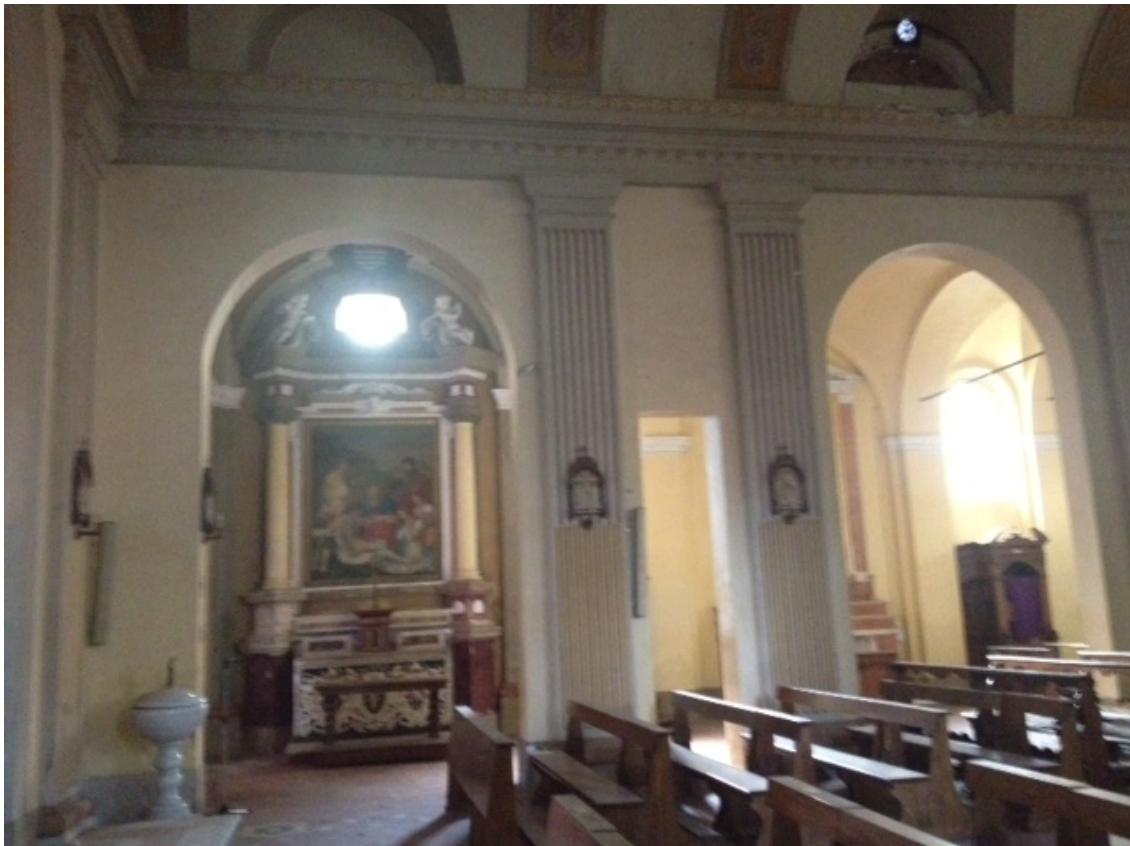
FOTO 17 - vista della navata laterale destra