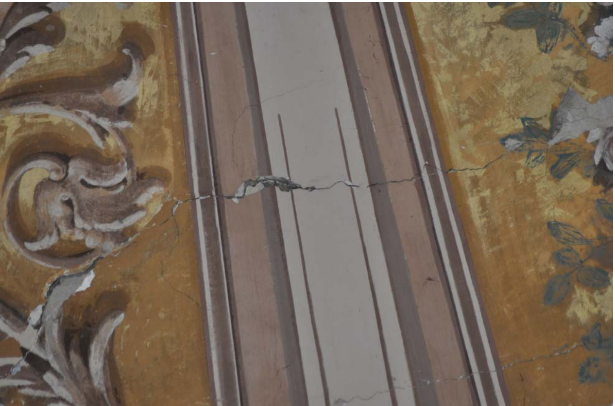
FOTO 20 - dettaglio fessurazione su volta in corrispondenza del transetto