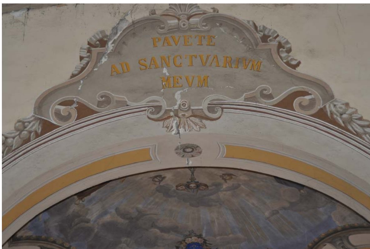
FOTO 12 - decorazione pittorica in corrispondenza del transetto