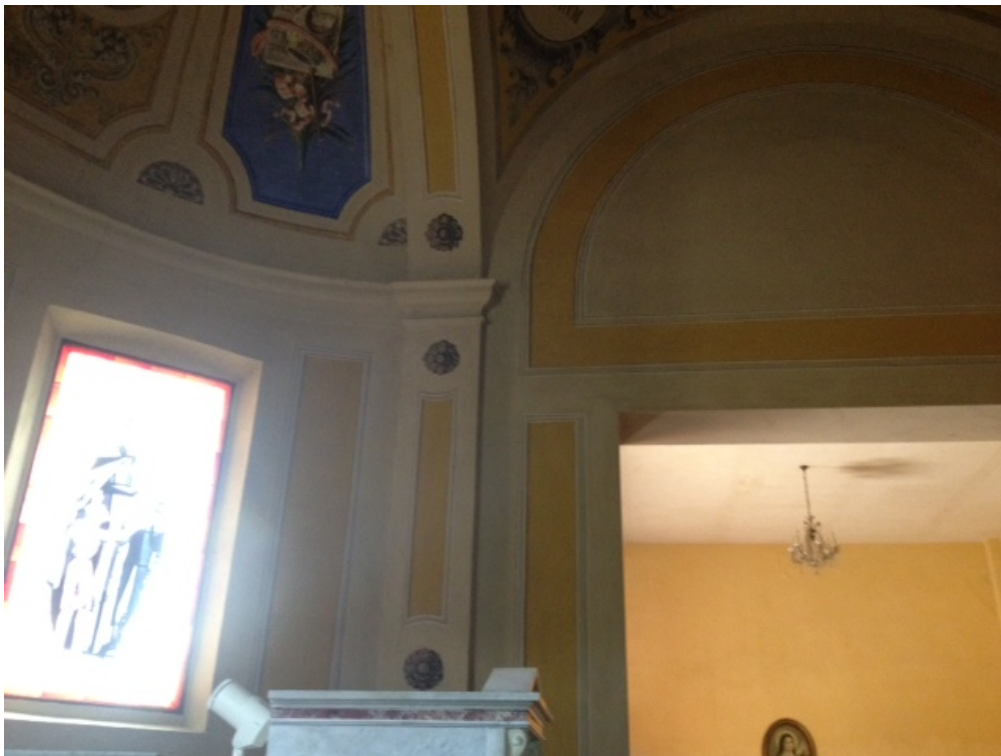
FOTO 14 - particolare dell'innesto abside - transetto