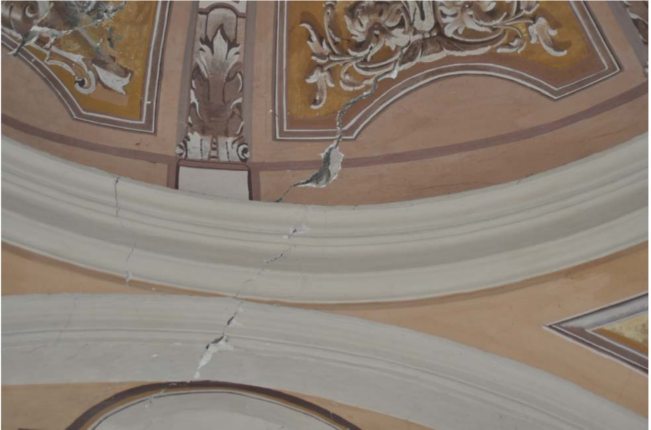
FOTO 19 - dettaglio fessurazione su volta in corrispondenza del transetto