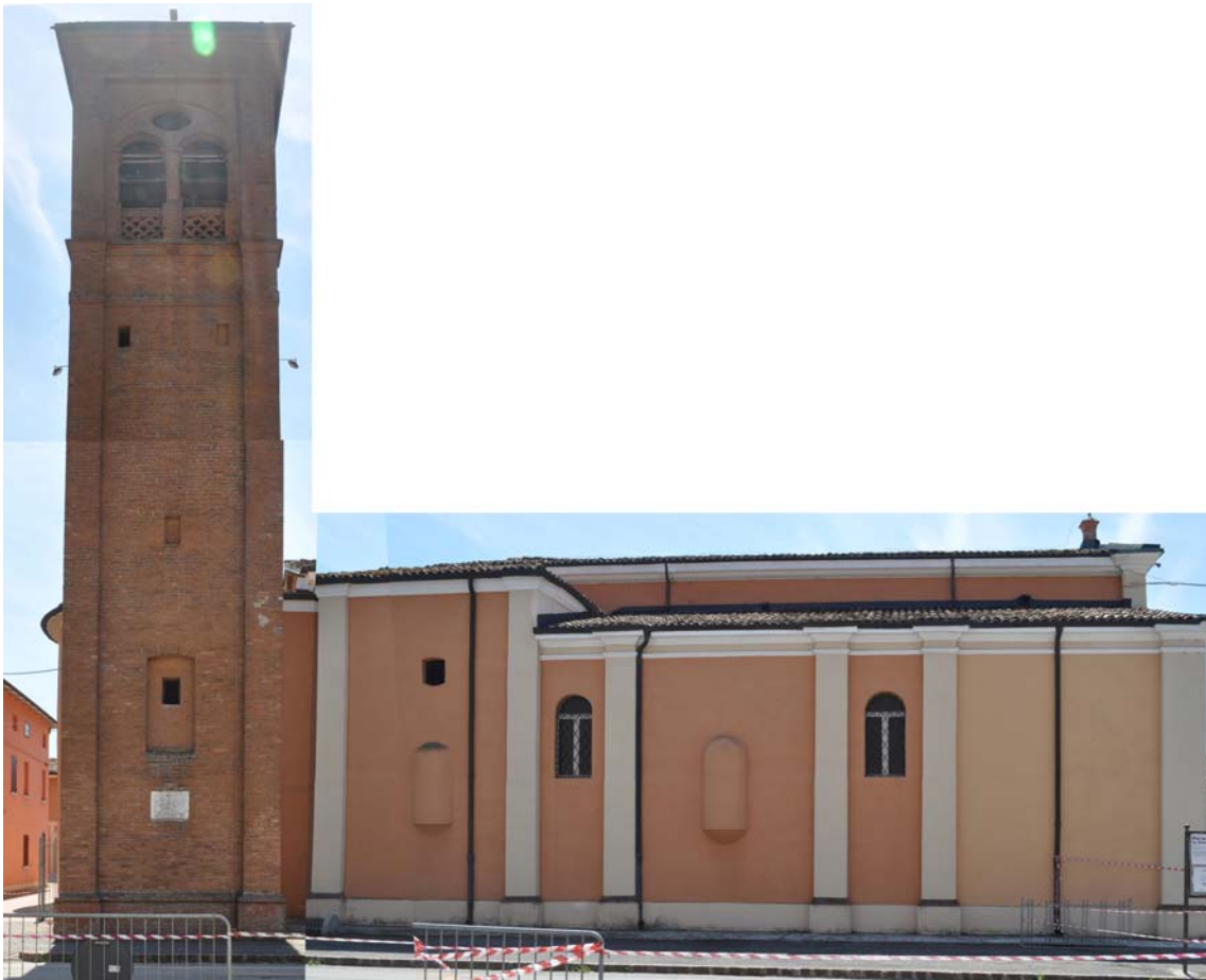
FOTO 2 - vista del fianco nord