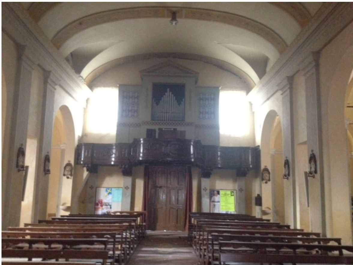
FOTO 9 - vista della parete di facciata con balconata in legno e organo