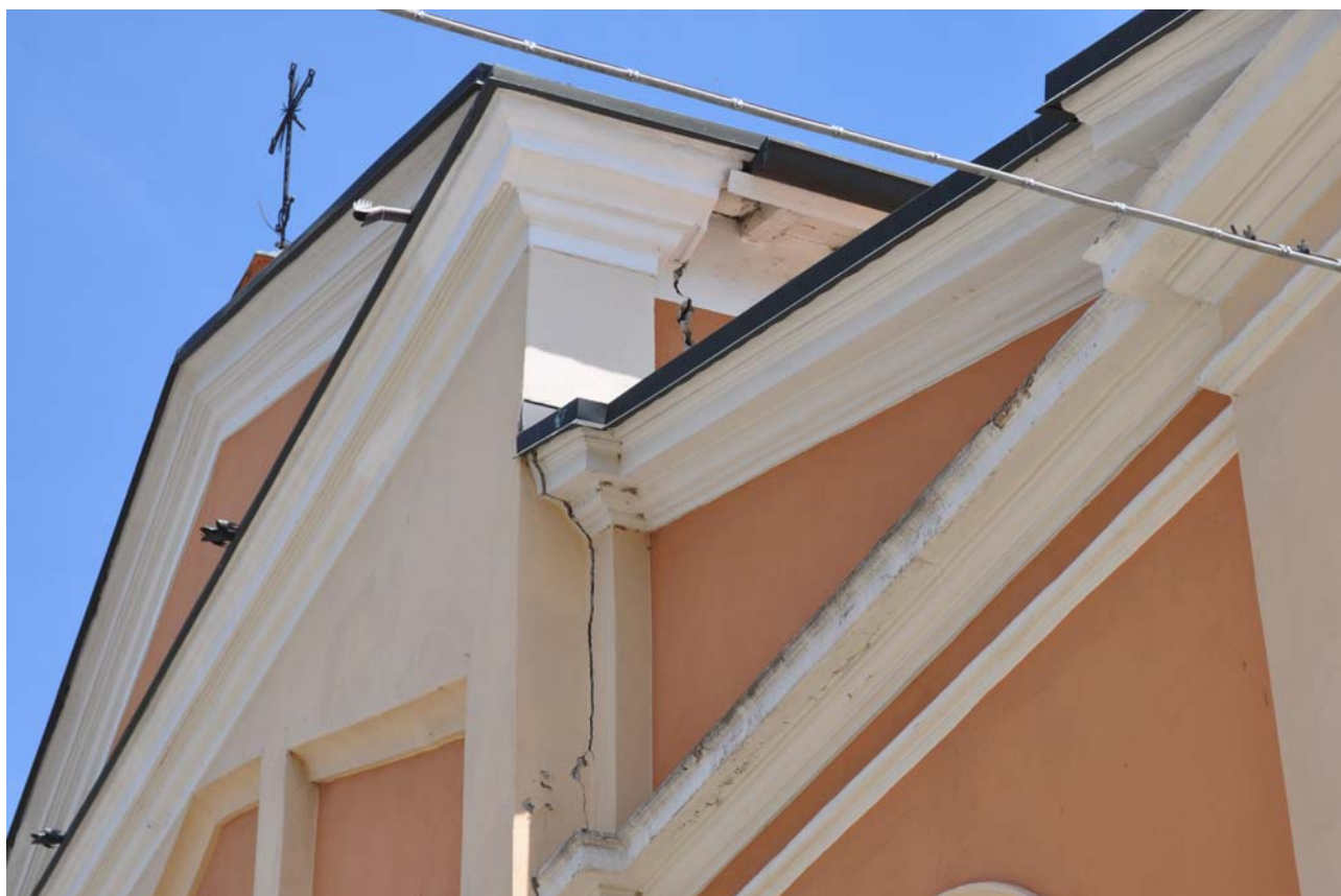
FOTO 4 - facciata principale con evidente lesione all'attacco con il corpo di fabbrica della chiesa