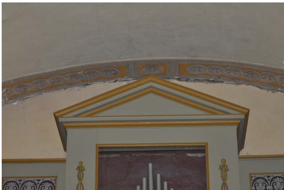
FOTO 10 - particolare del timpano che sovrasta l'organo: evidente la fessurazione all'innesto tra parete di facciata e navata centrale