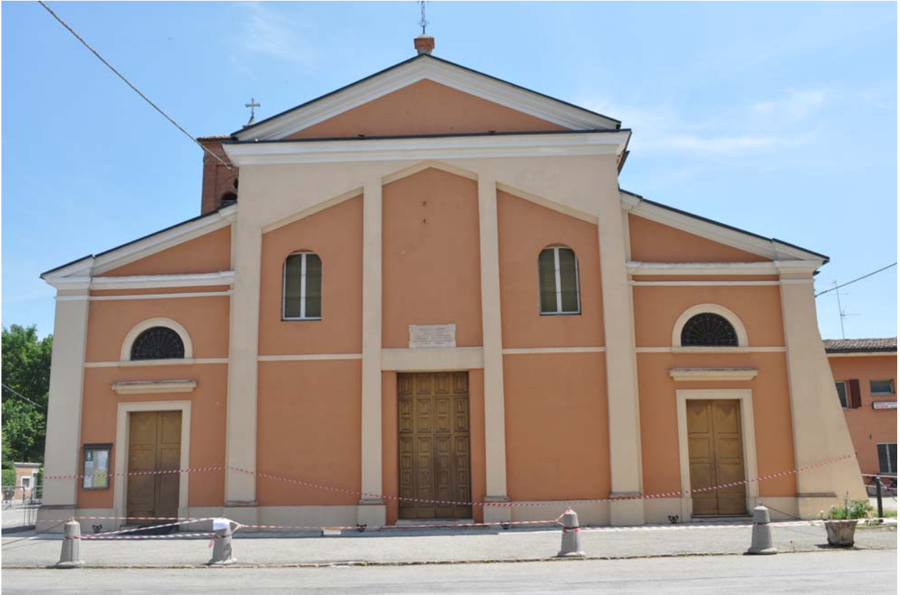
FOTO 1 - vista del prospetto principale della chiesa di San Giovanni Battista