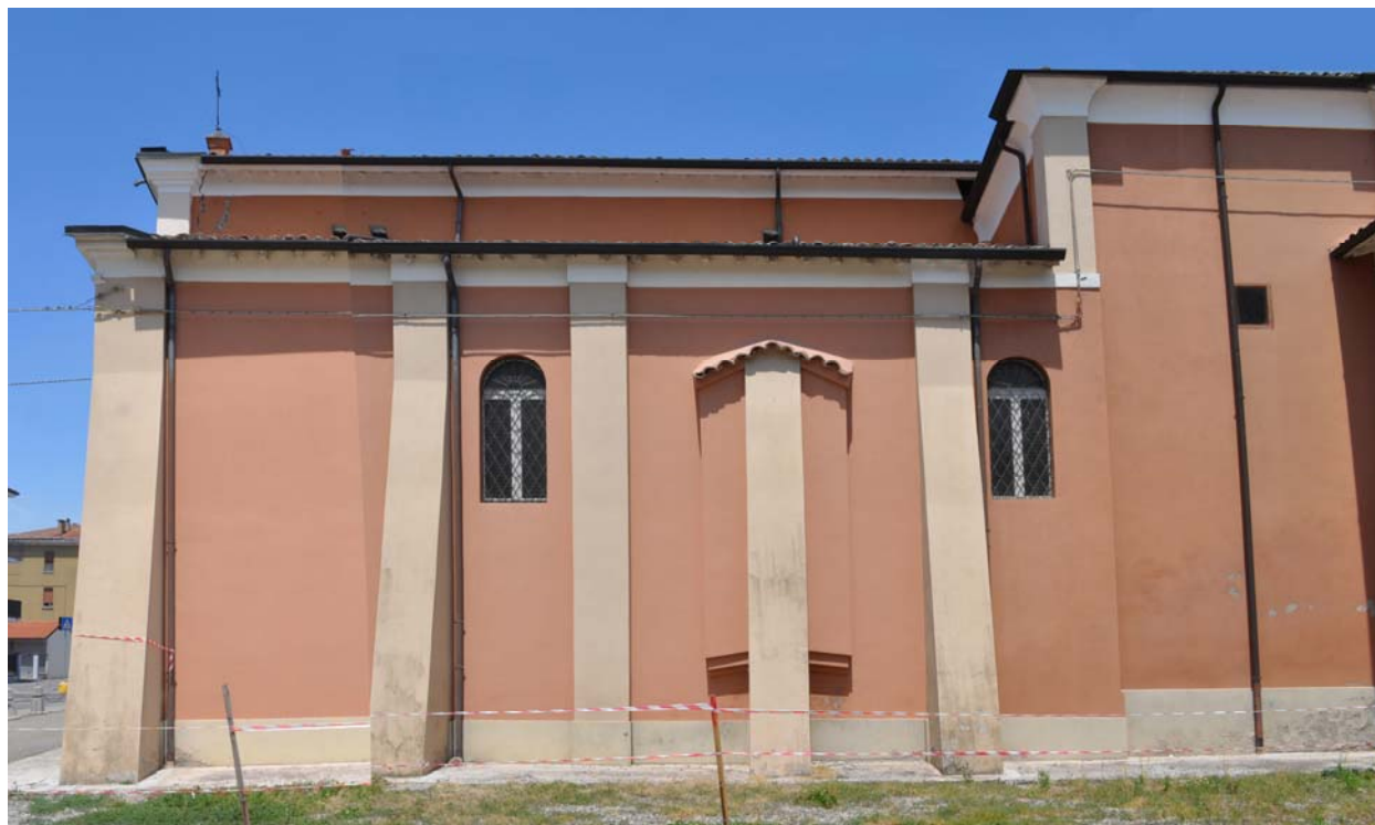
FOTO 3 - vista del fianco sud