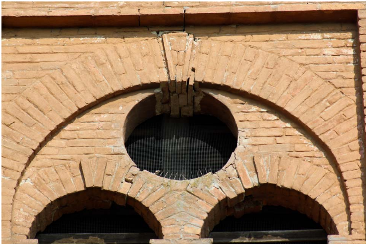
FOTO 8 - bifora del campanile con evidenti segni di dissesto in corrispondenza agli archi