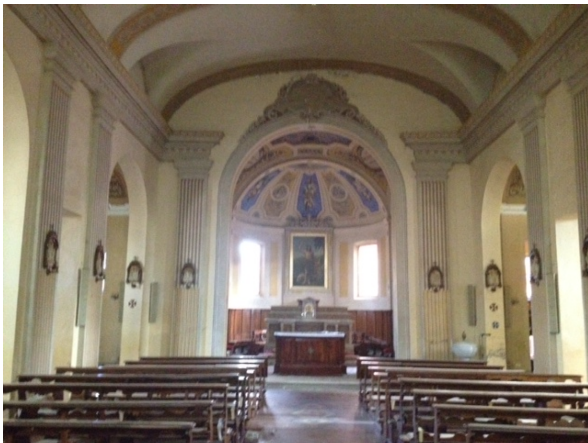
FOTO 11 - vista della navata centrale e dell'abside