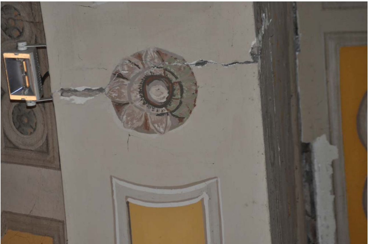
FOTO 16 - dettaglio dell'arco tra abside e transetto