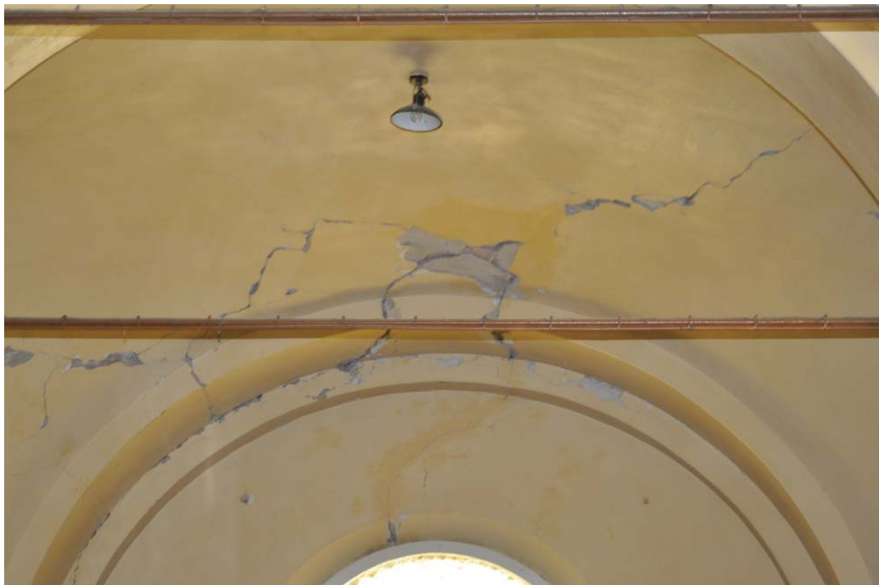
FOTO 21 - fessurazioni su volta della navata laterale destra (verso la parete di facciata)