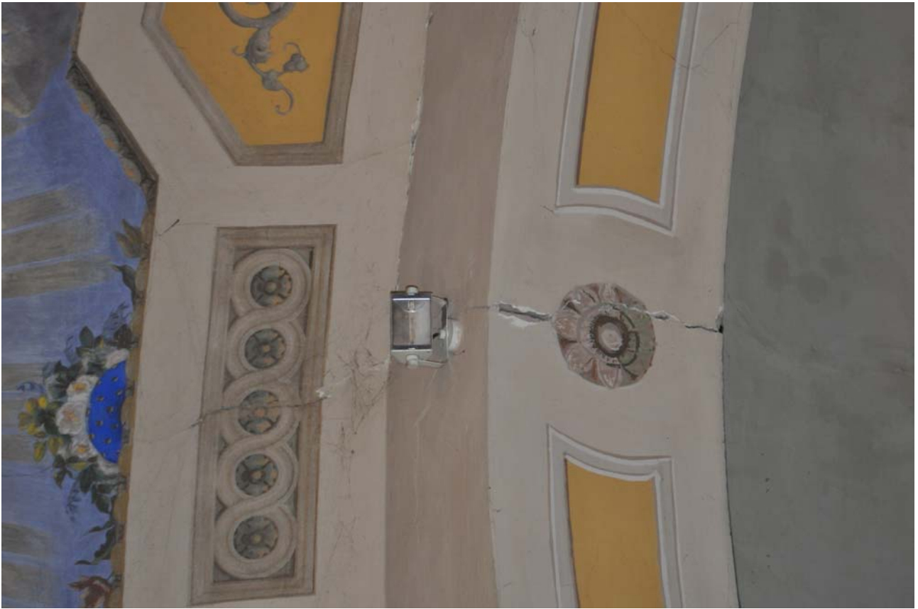
FOTO 15 - dettaglio dell'arco tra abside e transetto