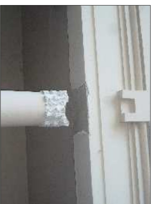
Capitello da integrare