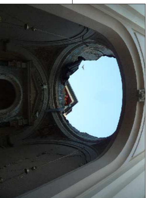
Foto della cupola crollata da ricostruire con mattoni in laterizio di recupero previa realizzazione di centinaitura lignea che riprenda la forma originaria Cappella della Beata Vergine del Carmine)