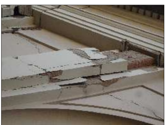
Parti di lesena da ricostruire con metodo cucisciuci