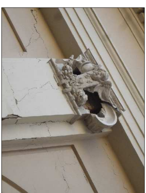
Capitelli da integrare nelle parti mancanti