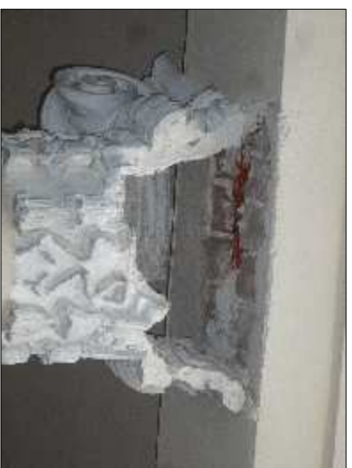
Capitelli da integrare nelle parti mancanti rilevando il disegno originale da quelli integri