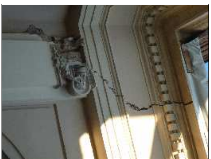
Capitelli lesena da ricostruire