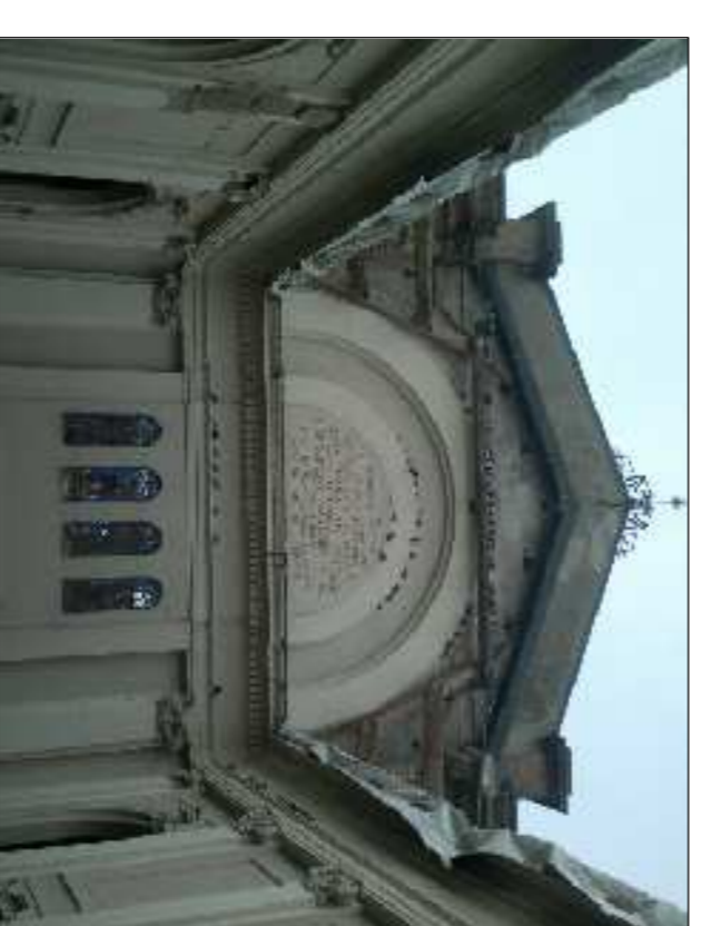
▲ 45 - Situazione copertura dopo lavori di messa in sicurezza.