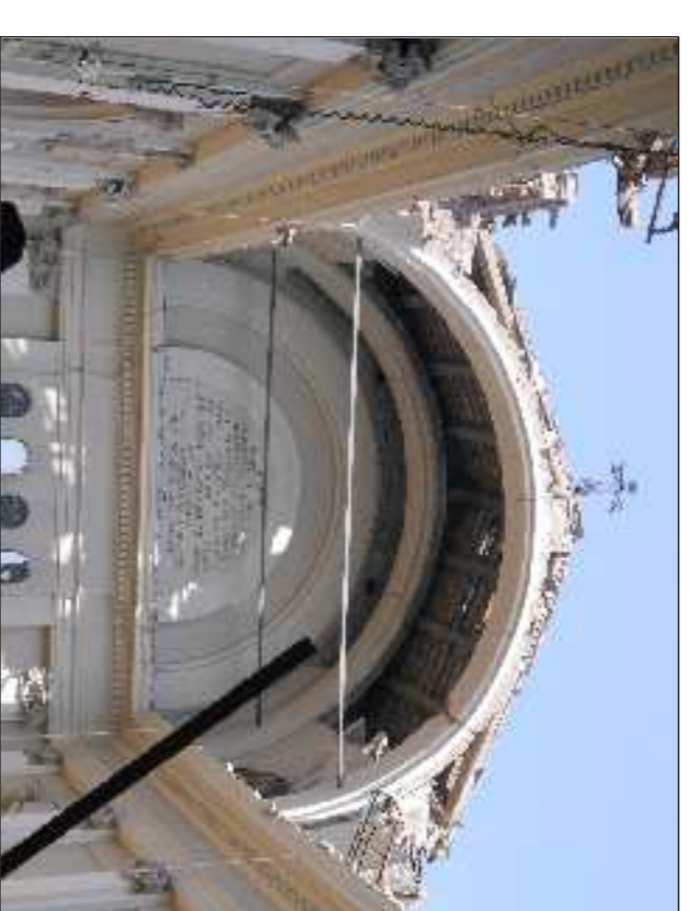
▲ 44 - Situazione copertura dopo lo scasso