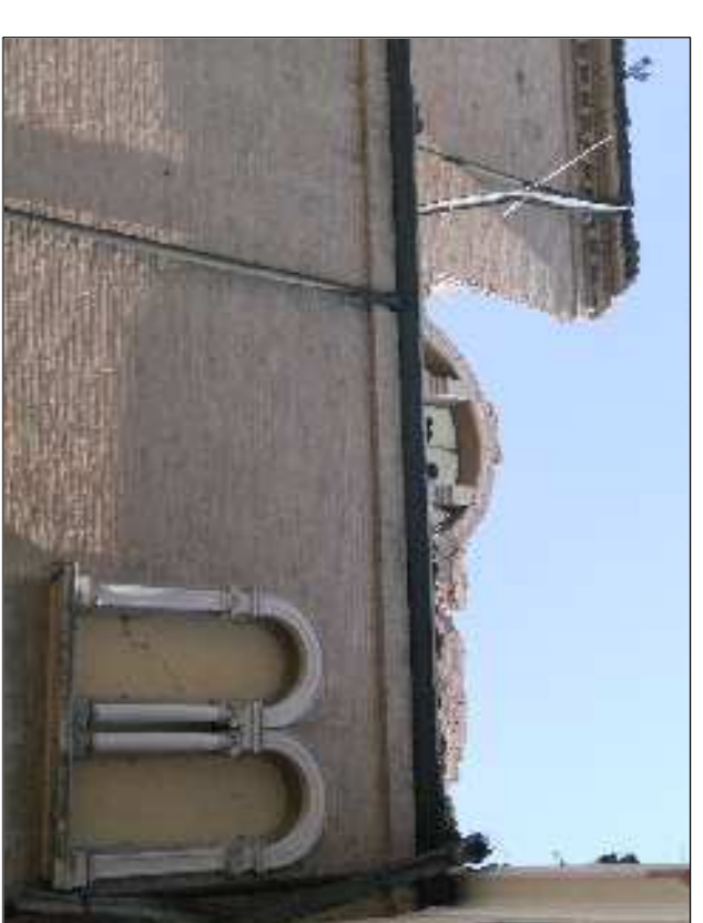
▲ 43 - Situazione parete destra primo della messa in sicurezza.