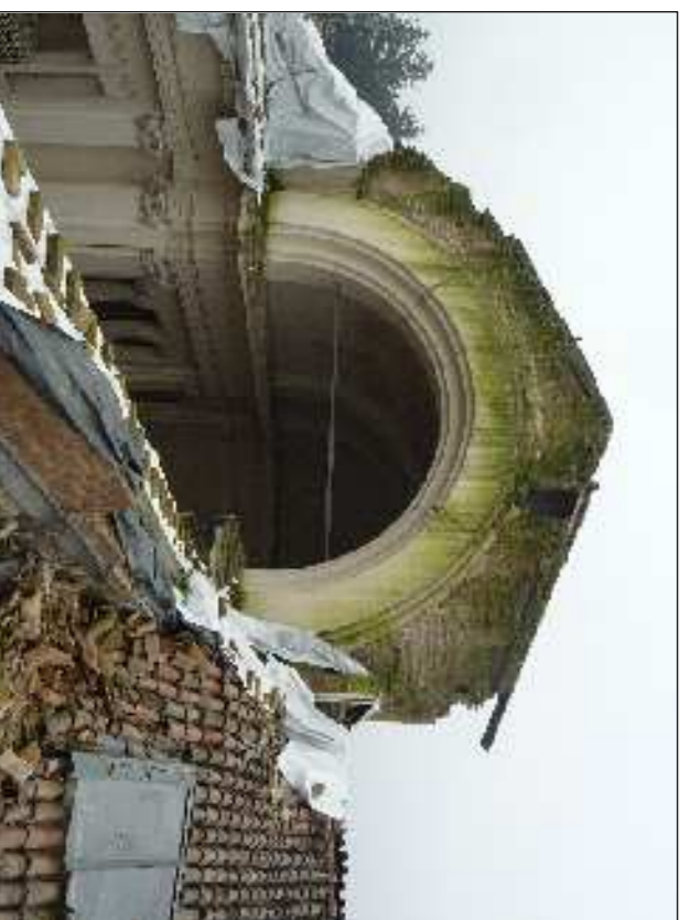
▲ 42 bis