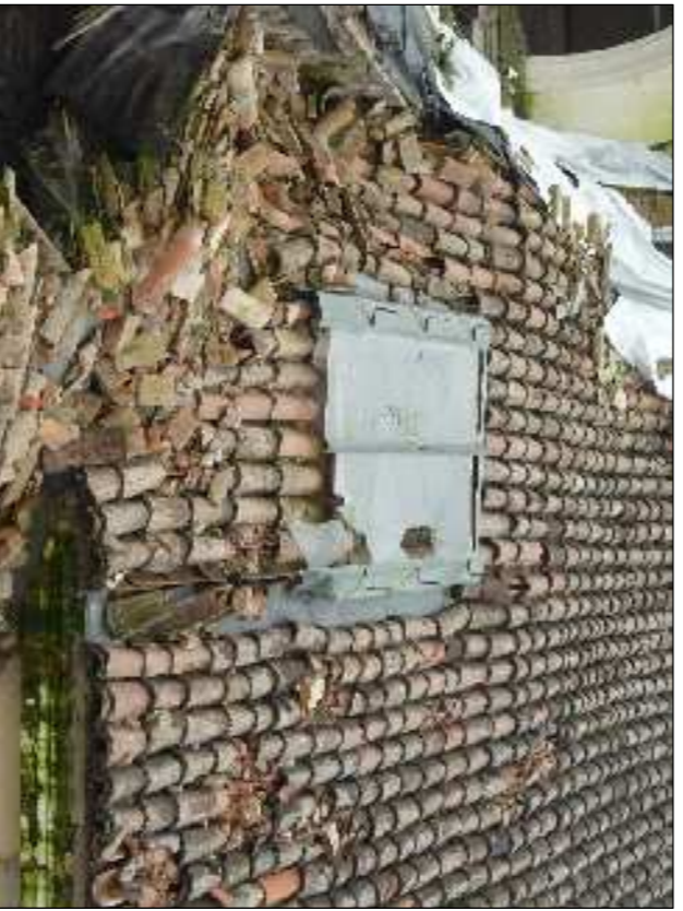
▲ 41 - Copertura campanile danneggiata in adiacenza alla chiesa.