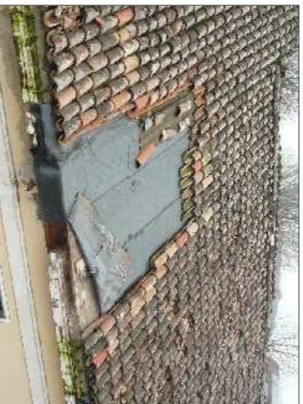
▲ 40 - Copertura vano scale visto dall'alto.