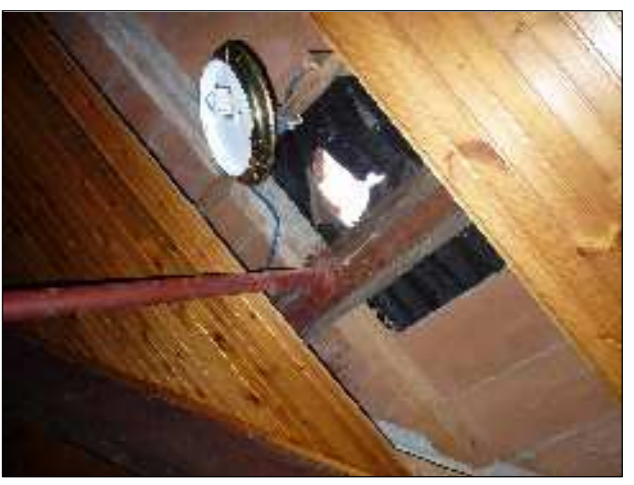
▲ 38 - Porzione copertura danneggiata per caduta di frammenti del campanile.