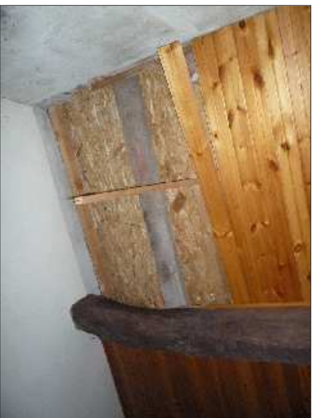
▲ 36 - Porzione copertura vano scale danneggiata per caduta di frammenti del campanile.